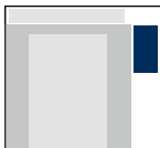
Skyscraper L 150 x 300 Pixel