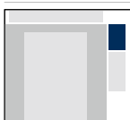
Skyscraper S 125 x 200 Pixel